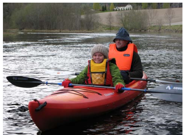
Kanotur på Bø-elva