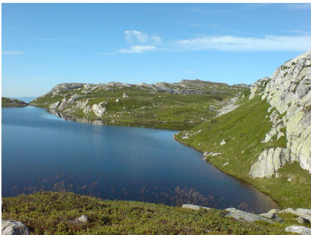
Skåråfjellholmen på Lifjell

Bø Turlag har omlag 230 medlemmer. Laget er medeigar i Løypelaget som bl.a. kjører opp Vihusløypa og skiløypene nede i bygda.