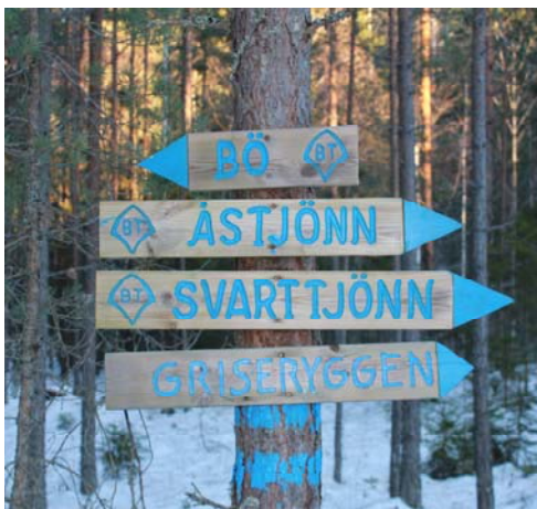
Turlagets gjenkjennelege blåmalte skilt