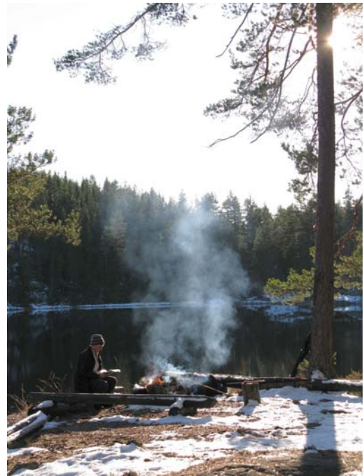
Store Damtjønn, Breisås