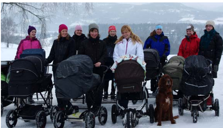
Turglade trillrarar