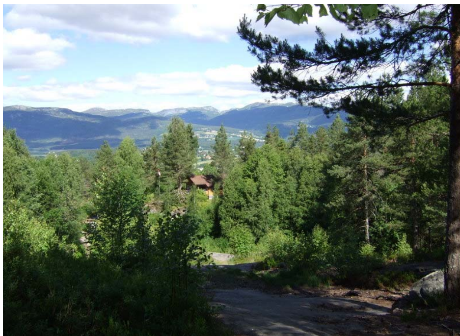
Utsikt frå Torstveitskotet, Breisås