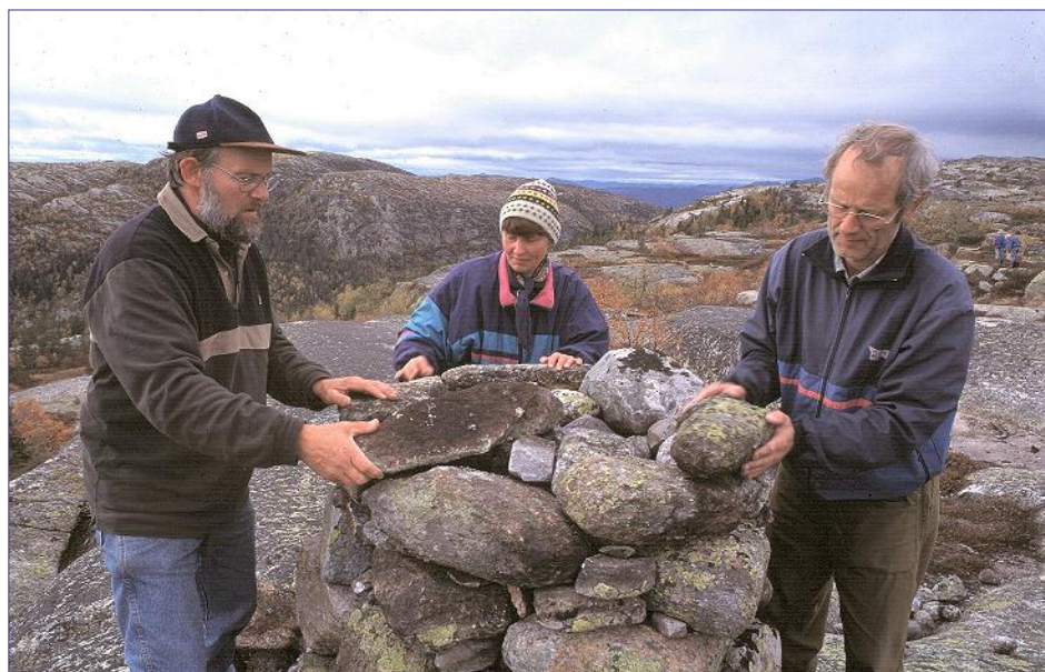
Bygging av turlagets jubileumsvarde.

Ønskjer du å gå ein rundtur, kan du legge tilbaketuren frå Bryggefjellnuten om Tjønnsuldalen. Da kan det passe å ta ei rast ved Skjentjønn før du går ned i Tjønnsuldalen og møte gammal grov granskog og ei blinkande tjørn. Ein kort