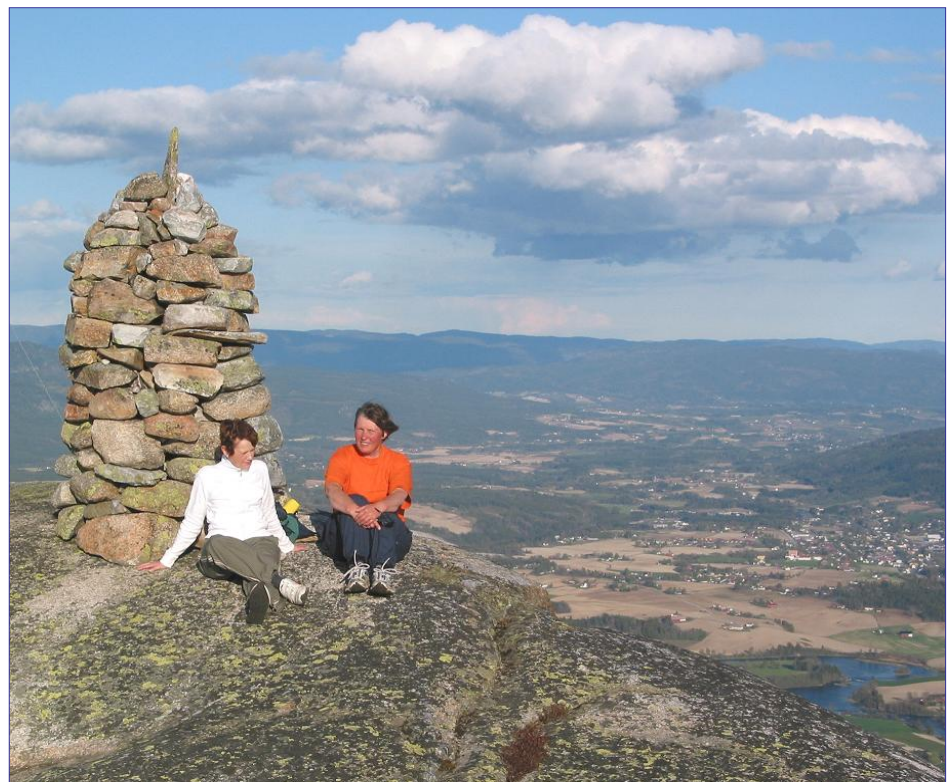
Utsikt frå varden mot Bøbygda.

sidesti fører deg til den nedlagte plassen Ånto. Nede i Langeskora går stien bratt opp til Dingdangkyrkja – ei stor hole under kampesteinar. Det er lagt ut taug for dei som treng noko å halde seg i. Frå Dingdangkyrkja går stien tilbake til Kolahuset og parkeringsplassen.