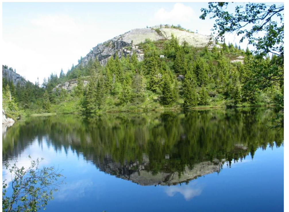
Trolltjønn mot Alfarnuten.

Eit alternativ til den blåmerka stien over Gamlestulfjellet er å gå inn Bjønndalen. Herifrå kan du rusle på umerka stiar inn til Nystul og vidare til Tjønnfly og Diplemyr. Eller kanskje du heller vil ta turen opp på Hjuringfjell og Sveivelinuten, men her inne finn du nok bare dyretråkk – om du er heldig.