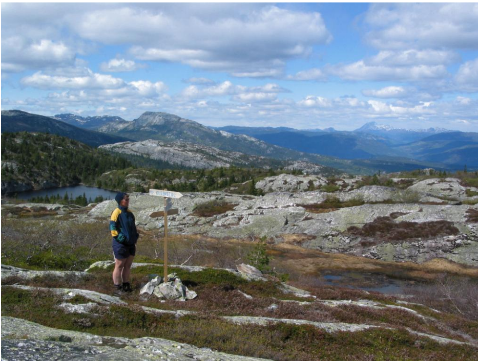
Frå Rypeskaret på Bukkelifjell.

Nord for Stoklandgrenda ligg eit stort skog- og heiområde som er ukjent for mange. Gamlestulfjell, Hjuringfjell og Sveivelinuten ligg her. Lengre nord ligg Anderslifjell og Røytebufjell med Trolltjønn og Alfarnuten. Heiane er rike på minne om tidlegare tiders bruk av naturen. Dei vitnar om ein annan og hardare kvardag enn vår. Det er ikkje husdyra, beitemarkene, setervollane og dei gamle ferdselsvegane som pregar landskapet i vår tid. Skogen har teke over, men myrar og blinkande små vatn liver opp. Ein merka sti frå Røysland til Kleivstul og Alfarnuten fører vandraren fram til blåmerka sti rundt Bukkelifjell. Utanfor dei merka stiane er det spennande "villmark" for dei som ønskjer å ta seg fram på eiga hand.