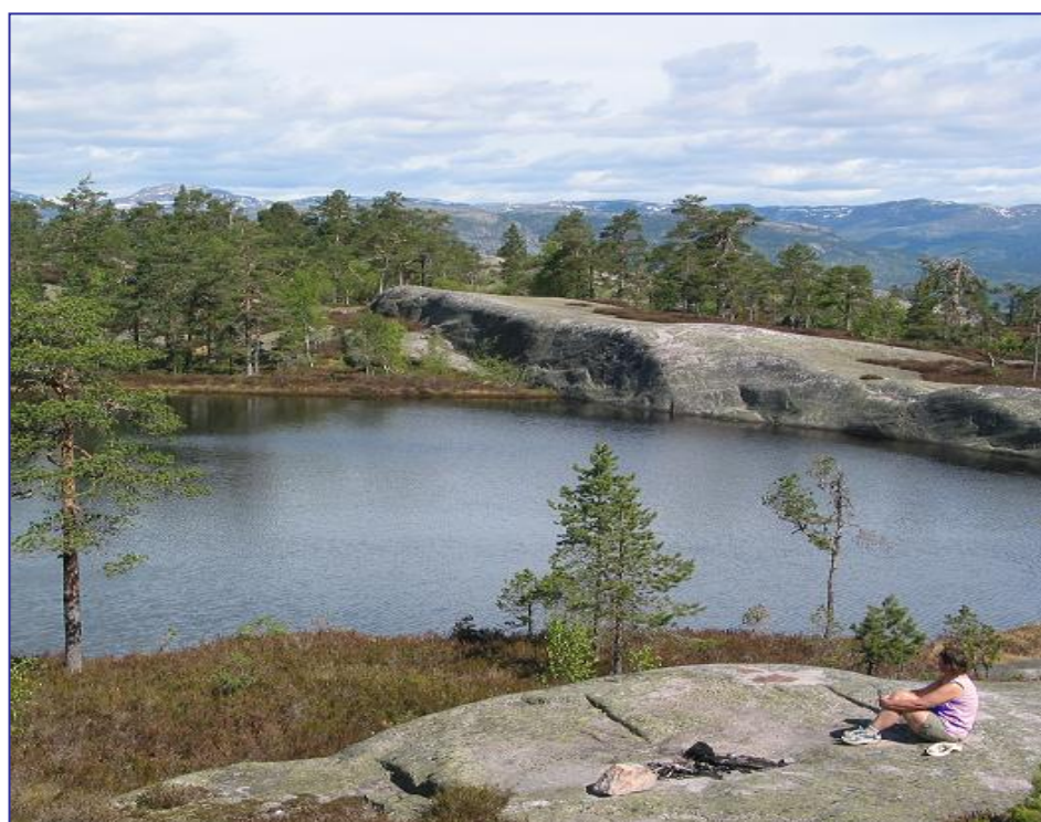
Venetjønn mot Liffel.l

Tilbaketuren legg vi mot vest. Ved postkassa til Bø Turlag tek vi stien til høgre. Stien fører oss ned i gammal skog med kvitrande fugleliv. Litt lenger framme kan vi ta ein avstikkar opp til Maurknatten. Herifrå har ein den beste utsikta mot ura