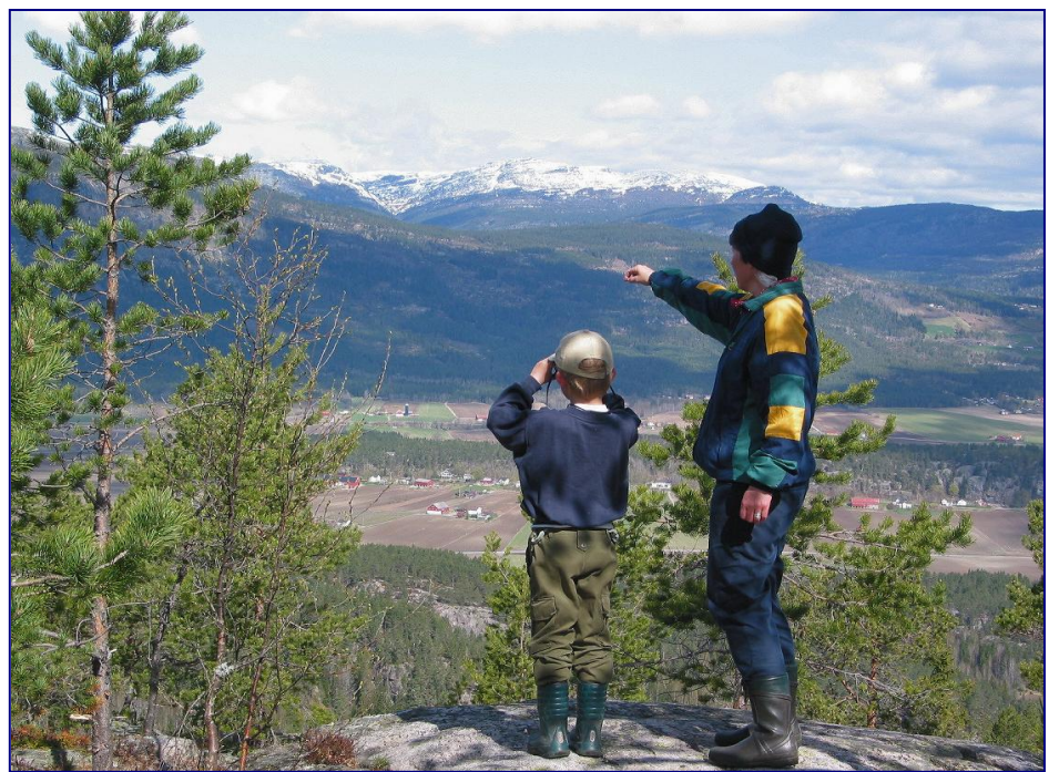
Høyslass mot Forberg, Liheia og Lifjell lengst bak.

Høyslassnuten. Følg skilt og merka sti heilt fram. Ved toppen av Bruskor vitnar utsprengt stein om skjerp etter molybden. Like under Høyslassnuten ved stien på austsida, finn du ei lita olle som ga kaldt godt vatn også i tørkesumaren 1947. Like ved plassen Skorra under Bruskor, har vi skilta til ein mura brønn.