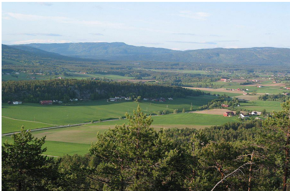
Utsyn frå stien bratt opp frå parkering ved Forverg – mot Forbergåsen og Bødalen bak.

Vi finn mange husmannsplassar som er avmerkt på kartet. Husa er borte, men framleis kan ein sjå tufter og steingjerde. På plassen Høyslass sto husa til ca 1930. På husmannsplassen Høymyrane hende tragedien som er fortalt i bygdeboka: Mannen døydde og kjerringa vart sparka i hel av hesten.