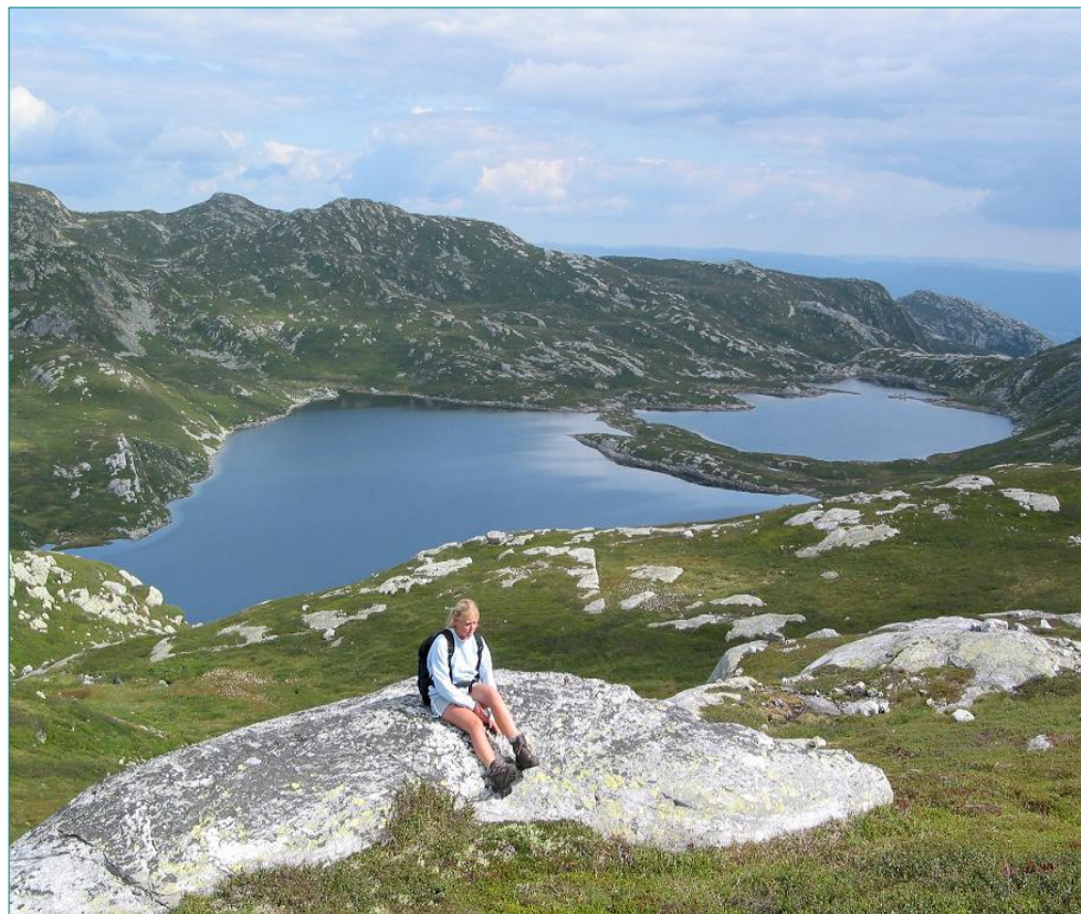
Utsikt mot Holmen