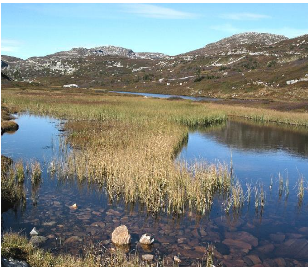
Frå Langetjønne.

For dei som ønskjer å gå utanom merkte stiar, kan vi tilrå ein tur over Røksbufjellet der Repetjønne lyser opp i landskapet og byr på fine rasteplassar. Under Valjuvsnatten ligg Valjuvshola. Segna fortel at ein hund forvilla seg inn i hola og kom ut igjen i Hjartdal - men da var pelsen svidd!